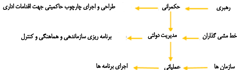
تصویر ۳. روابط بین ۳ سطح حاکمیتی، مدیریت دولتی و فعالیت‌های عملیاتی